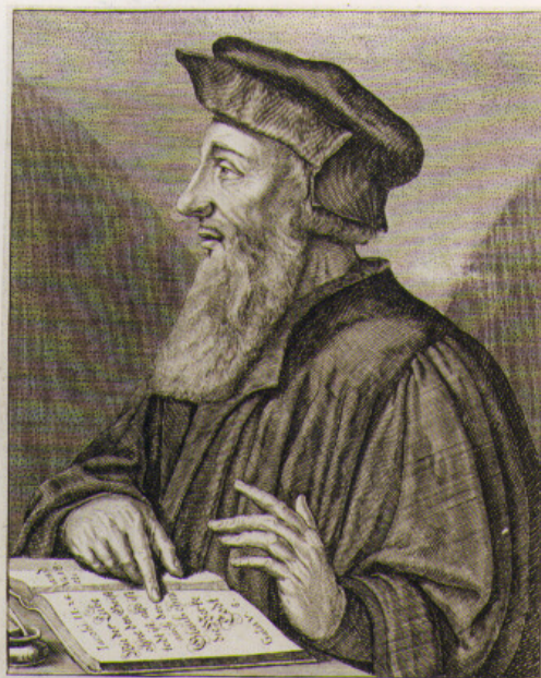
IOANNES OECOLAMPADIUS, BASILIENSIS ECCLESIAE PASTOR, GERMANUS. Vuinsberga Francie oppido oriundus. A. M. CCCLXXXII. Obijt KL Decemb. A. M. D. XXXI. Aetatis suae. 49. Oecolampadius Divini lampade Verbi Clarius, hoc tenebras discentiente procul, Purior haud potuit lampas lucescere Mundo. Quam probitas sancti Spesque fidesque viri.