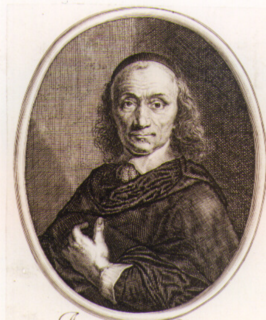
Antonius Vitreus Regis et Cleri Gallicani Typographus. 50