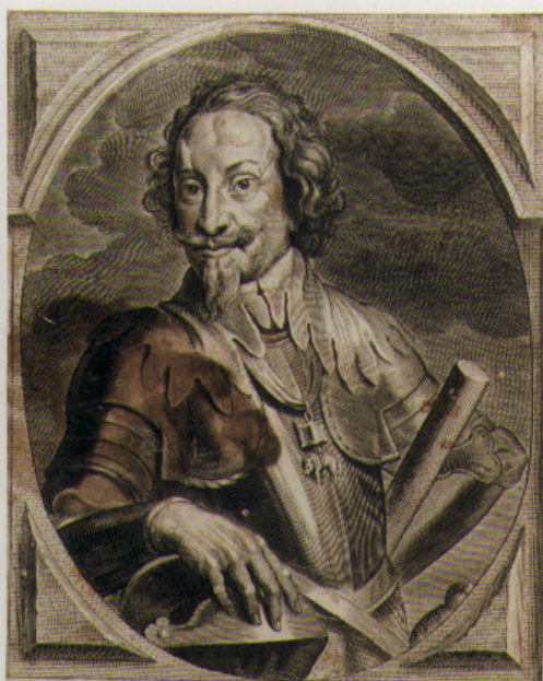
Godefroy Henry Comte de Papenheim du Conseil Secret de Sa Ma te Imperiale, son Marichal de Camp General 88 51