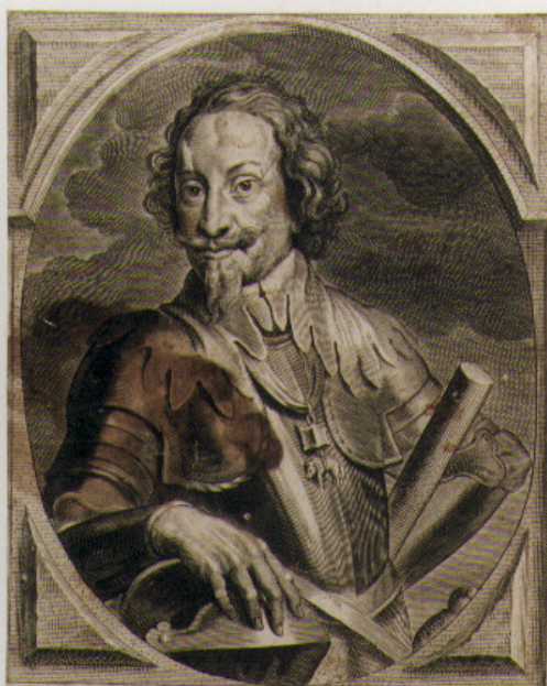
Godefroy Henry Comte de Papenheim du Conseil Sublicqui de Sa Ma e Imperiale, son Marichal de Camp General 8851