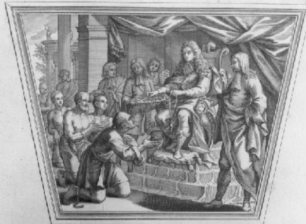
Vilissimis mancipijs Fidei doctrina imbutis pūlcherrimum Cælo spectaculum præbet Regem Catechisæ Magistrum