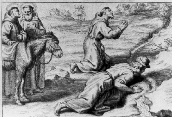
Due imagines B. Francisci in pariete Ecclesie superioris FF. Minorum Conventualium Alsily (in cuius inferiori Sacrum eius corpus requiescit) a Giotto pictore circa An o 1290 depictæ