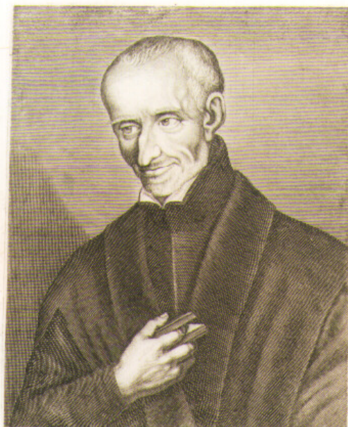
P. Dionysius Petavius Aurelianensis e societate Iesu obijt Parisijs die xi. Decembris. An. 1652. ætatis suæ 70. A. sive. fact.